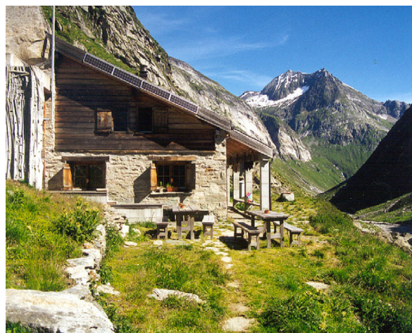
Länta-Hütte 2090 m